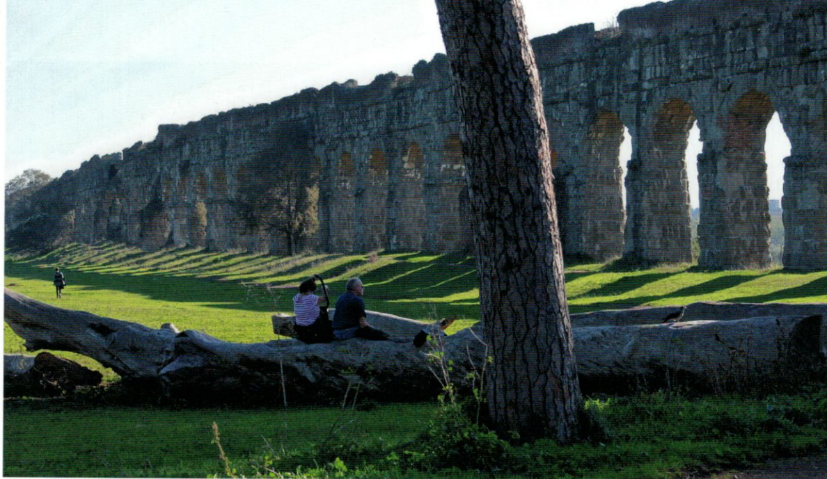
Unik förening av tid och rum. Antikens akvedukter har förvandlats från livgivande vattenbärare i ett jordbrukslandskap till väldiga skulpturer i den välvårdade stadsparken Parco degli Acquedotti sydost om Rom. Akvedukten Claudias väldiga konstruktionsbågar av tuffsten bär akvedukten Anio Novus överst. Båda stod klara 52 e.Kr.

I vår bok Rom – arkitektur och stad , har vi velat lyfta fram den unika italienska huvudstaden som en mångfacetterad, komplex och närmast outsinlig källa för arkitekturvetenskapliga studier av relationerna mellan byggnad och stad, mellan fasad och stadsrum och inte minst hur komplicerade infrastrukturfrågor påverkar det urbana landskapet. Vi inleder med att skildra hur antikens Rom förändrades under en 700-årig period från lantlig småstad till huvudstad i ett imperium. Ny infrastruktur med akvedukter, kloaker, vägar, flodhamnar, broar och avancerad byggteknik med nya byggmaterial bidrog till arkitektoniskt nytänkande i en allt snabbare pulserande storstad. Nya byggnadstyper och en urban typologi med stadsrum för olika offentliga ändamål skapades. Ett flertal av dessa byggnadstyper kom i utvecklade former att bli bestående inslag i senare västerländskt stadsbyggande.