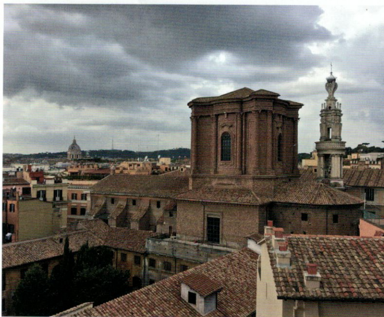
Francesco Borromini var både skulptör och arkitekt och hans verk blev kongeniala under barocken då man eftersträvade dynamik och rörelse. Ofta betraktades, paradoxalt nog, hans arkitektur som alltför »barock» och provocerande av samtida kritiker. Idag kan man få en helt unik upplevelse från den nya publika takterrassen på varuhuset La Rinascente. Borrominis fantastiska kupoltrumma och klocktorn från 1660-talet på Sant Andrea delle Fratte framträder på ett nytt sätt i stadssilhuetten.

I barockens Rom fullföljdes satsningarna, och en formlig explosion av djärv arkitektur uppfördes med dynamik och rörelse som ideal. Arkitektur och konst togs gärna i anspråk som scenografi utnyttjad för tillfälliga evenemang och fester i staden. Efter ett millenium av förfall hade arkitektur och stad åter förenats till en raffinerat gestaltad och fungerande helhet med ett dynamiskt stadsliv.