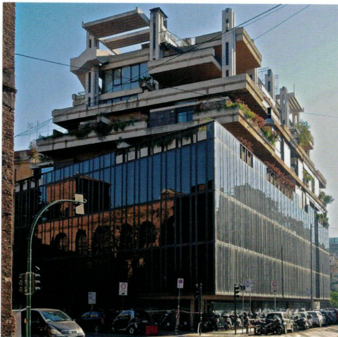
Stadsmuren vid Via Campania speglas i glasfasaden på Edificio polifunzionale ritad av Passarelli Studio 1965. En av de allra tidigaste mångfunktionella byggnaderna i 1960-talets Rom. Arkitekturen uttrycker den komplexitet som tre urbana verksamheter inom samma byggnad medför. Bottenvåning med handel och servicelokaler i gatuplanet, glasat mittparti med kontor i 3 våningar och överst 12 lägenheter med terrasser och spektakulär utsikt över Roms taklandskap.