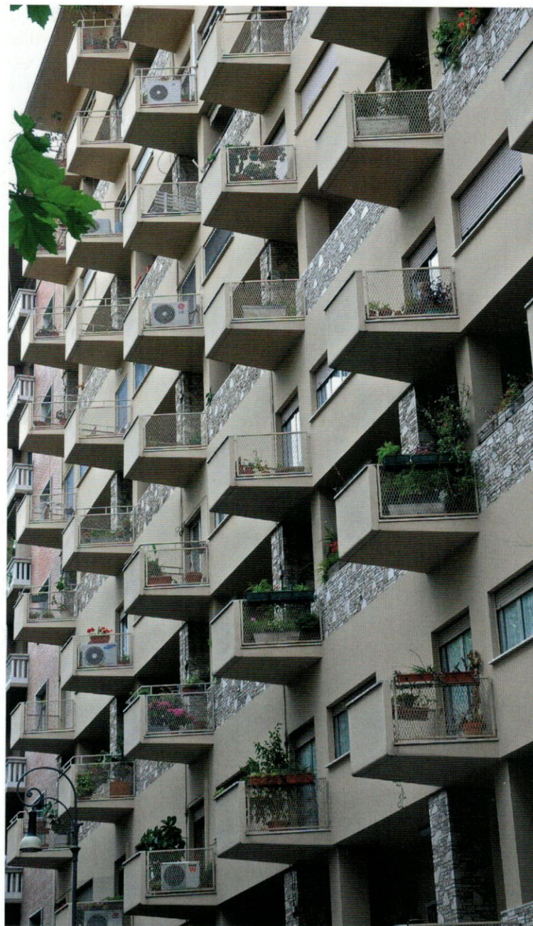
Bostadshus, så kallad intensivo, med 10 våningar på Viale Pinturicchio i Flaminiokvarteren 1950 av arkitekten Ugo Luccichenti. Lägenheterna är ljusa och rymliga och uppfattas fortfarande som moderna och attraktiva med hög kvalitet, centralt belägna nära spårvagn. Eleganta balkonger och utstuderat materialval ger en närmast grafisk fasadupplevelse.

åter en miljonstad. Det tilltänkta världsutställningsområdet EUR och ett nytt universitetsområde anlades samtidigt som modernismen eller den italienska rationalismen gjorde intåg och bidrog till en särpräglad förening av antik och modernt.